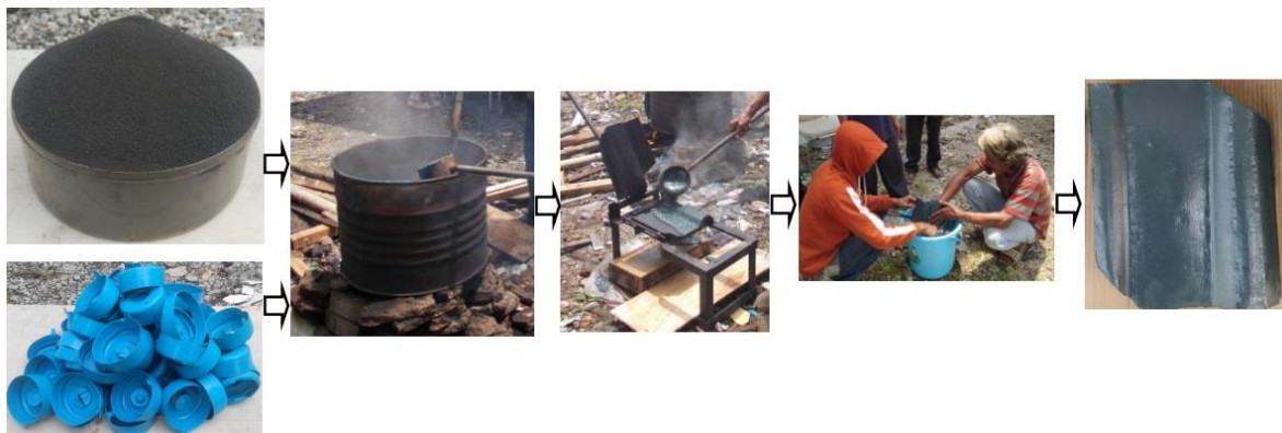
Gambar 2. Pembuatan genteng cetak dari campuran bahan baku tailing mangan dan perekat limbah plastik.