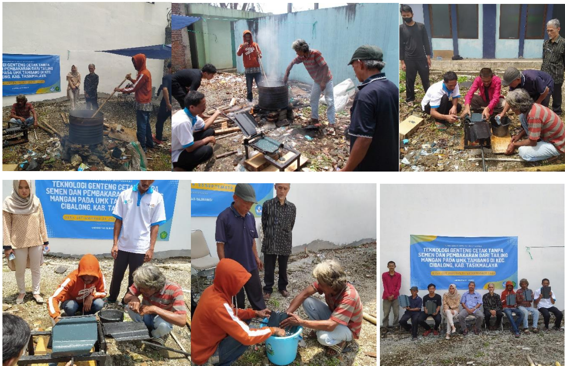
Gambar 5. Pelaksanaan kegiatan pelatihan pembuatan genteng cetak dari campuran tailing mangan dan perekat limbah plastik cair di Desa Setiawaras, Kec. Cibalong, Kab. Tasikmalaya.

Gambar 5 menunjukkan pelaksanaan kegiatan pelatihan pembuatan genteng cetak dari campuran tailing mangan dan perekat limbah plastik cair di Desa Setiawaras, Kec. Cibalong, Kab. Tasikmalaya. Pelatihan dan praktek dilaksanakan pada hari Sabtu dan Minggu tanggal 24 dan 25 September 2022. Para peserta yang hadir