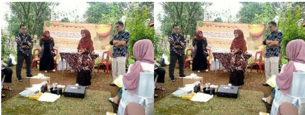
Gambar 3. Peserta Pelatihan Menyimak Penjelasan dan Aktif Melakukan Diskusi

Pada saat kegiatan pelatihan dan praktik, seluruh peserta menyimak terlebih dahulu informasi tentang jenis-jenis limbah yang mungkin dihasilkan dari proses atau kegiatan sehari-hari, limbah minyak jelantah, dan bahaya limbah tersebut terhadap lingkungan. Kemudian diberikan paparan bagaimana sistem teknologi pengolahan limbah yang mungkin dilakukan oleh masyarakat. Setelah itu tim pelaksana memberikan demonstrasi cara pengolahan minyak jelantah menjadi lilin wangi. Seluruh peserta pelatihan menyimak dengan seksama penjelasan dari tim pelaksana dan aktif melakukan tanya jawab.