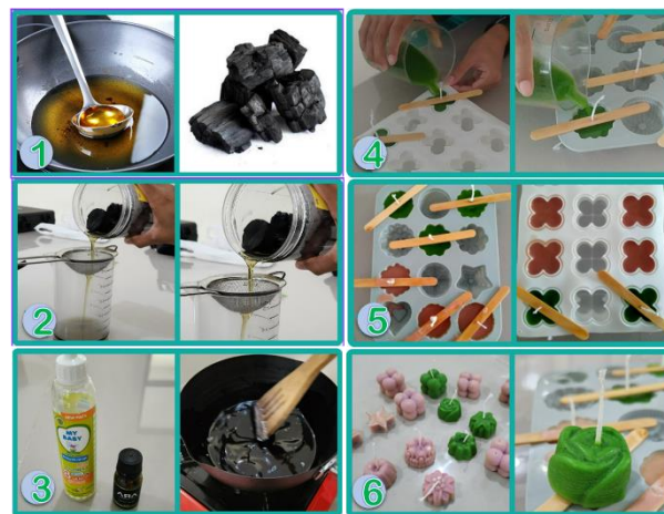
Gambar 2. Proses Pembuatan Minyak Jelantah Menjadi Lilin Wangi

Setelah proses perendaman, selanjutnya bahan disaring untuk siap dipanaskan kembali. Masukkan bubuk stearin, minyak yang telah disaring, dan bubuk krayon dalam wadah panci dan panaskan sekejap semua bahan hingga keseluruhannya menjadi liquid. Bubuk stearin berfungsi untuk mengeraskan minyak dan krayon berfungsi untuk memberi warna. Pada saat suhu campuran turun dan sebelum liquid memadat, berikan beberapa tetes minyak aroma terapi sebagai pemberi harum pada bahan. Sambil diaduk, bahan tadi kemudian dituangkan ke dalam cetakan lilin atau wadah lilin dan diberi sumbu ditengahnya. Proses pembuatan lilin wangi pun telah selesai dan tinggal menunggu lilin mengeras hingga siap untuk dimanfaatkan. Keseluruhan proses tahapan pembuatan lilin wangi ini dapat dilihat pada Gambar 2 .