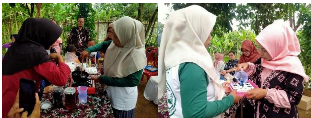
Gambar 5. Praktik Pembuatan Lilin Wangi Dilakukan Oleh Peserta Pelatihan

Supaya kegiatan pelatihan ini mampu memberikan keterampilan tambahan kepada seluruh pesertanya, maka diberikan pula sesi praktik membuat lilin wangi dari minyak jelantah yang langsung dilakukan oleh peserta secara bersama sama dan bergantian. Disediakan bahan-bahan yang dapat digunakan oleh peserta untuk membuat lilin wangi. Dengan bimbingan dan arahan dari tim pelaksana, peserta pelatihan antusias untuk mempraktekan cara pembuatannya. Menanggapi aktivitas peserta, fasilitator/tim pengabdian berupaya memberikan jawaban dan penjelasan serta membimbing cara pembuatan dengan baik hingga peserta pelatihan merasa paham.