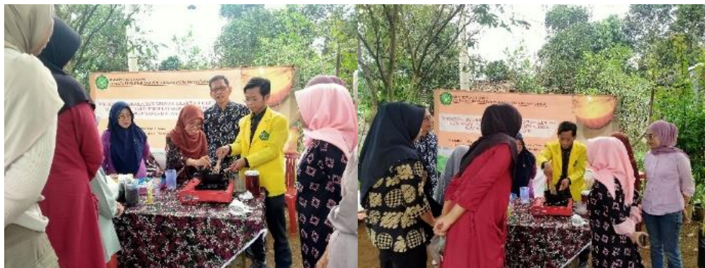
Gambar 4. Kegiatan Tim Pelaksana Melakukan Demonstrasi

Supaya kegiatan pelatihan ini mampu memberikan keterampilan tambahan kepada seluruh pesertanya, maka diberikan pula sesi praktik membuat lilin wangi dari minyak jelantah yang langsung dilakukan oleh peserta secara bersama sama dan bergantian. Disediakan bahan-bahan yang dapat digunakan oleh peserta untuk membuat lilin wangi. Dengan bimbingan dan arahan dari tim pelaksana, peserta pelatihan antusias untuk mempraktekan cara pembuatannya. Menanggapi aktivitas peserta, fasilitator/tim pengabdian berupaya memberikan jawaban dan penjelasan serta membimbing cara pembuatan dengan baik hingga peserta pelatihan merasa paham.